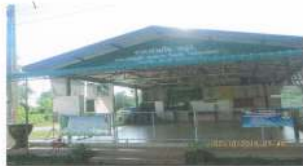
ศาลารามใจ หมู่ที่ ๓ ก่อสร้างในเขตที่ดินของผู้อุทิศที่ดินให้ที่สาธารณะ ในความดูแลของหมู่บ้าน