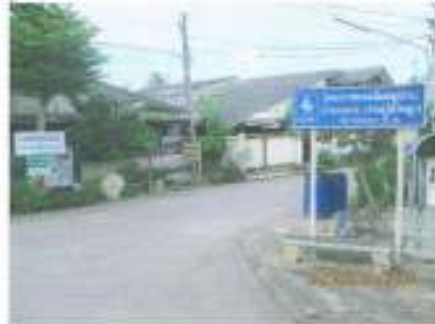
ถนนทางเข้าในหมู่บ้าน ไปถึงบ้าน ระหนอง หมู่ที่ ๒ ก่อสร้างโดย รพช. และปรับปรุงผิวจราจร โดยยูแอลพีเอสทีคิก คอนกรีต และลาดคอนกรีต โดยความดูแลของ อบต.คูบัว