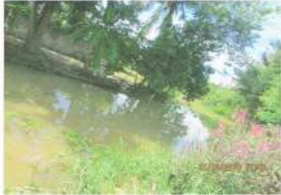
คลองชลประทาน ตั้งแต่สถานีรถไฟ หมู่ที่ ๒ ลงมาที่ หมู่ที่ ๓