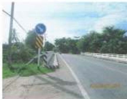
สะพานข้ามคลอง ถนนหมายเลข ๓๓๓๓๔ ในความดูแลของ กรมทางหลวง