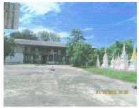
โรงเรียนชุมชนวัดคูบัว สังกัด สำนักงานเขตพื้นที่การศึกษาประถมศึกษาราชบุรี เขต ๓ ตั้งอยู่ในขอบเขตที่ดิน ของวัดคูบัว