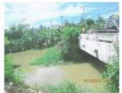
สะพานข้ามคลอง ภายในหมู่บ้าน ในความดูแลของ อบจ.ราชบุรี