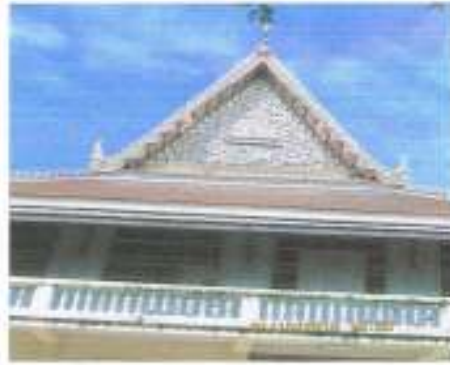
ศาลาการเปรียญ วัดคูบัว