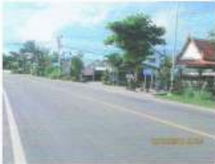
ถนนทางหลวง สายหลัก คูบัว ไปถึงทางแยก ถนนห้วยชินสิทธิ์ หมายเลข ๓๓๓๓๔ ในความดูแลของ แขวงการทางราชบุรี กรมทางหลวง

มีทางถนนสาธารณประโยชน์ ภายในพื้นที่เชื่อมต่อกันทั้งหมด มีทางถนนเลียบริมคลองตลอดทั้งสายเชื่อมต่อกัน