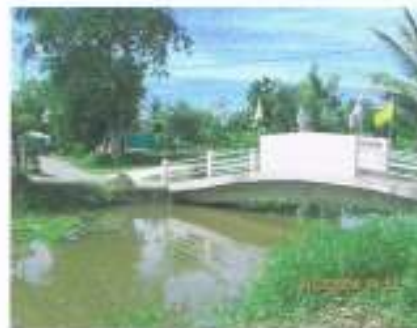
สะพานข้ามคลอง ภายในหมู่บ้าน ในความดูแลของ หมู่บ้าน งบ SML