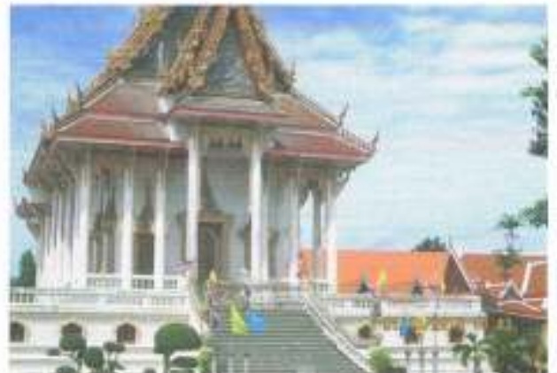
ที่ทำการองค์การบริหารส่วนตำบลคูบัว (ราชการส่วนท้องถิ่น) ตั้งอยู่ในขอบเขตที่ดินของ วัดคูบัว