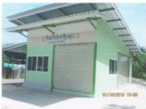
ร้านค้าประชาชนรัฐก่อสร้างในเขตสาธารณะ ในความดูแล ของหมู่บ้าน (กองทุนหมู่บ้าน)