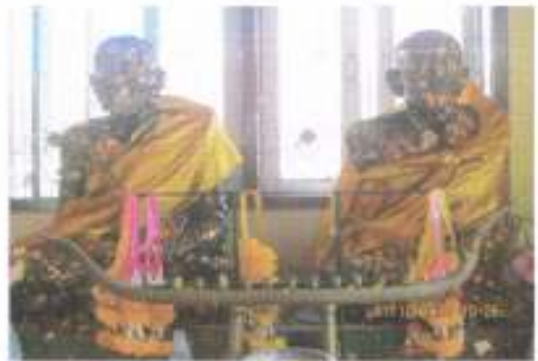
องค์หลวงพ่อแดง และ หลวงพ่อดำ พระพุทธรูปศักดิ์สิทธิ์คู่วัดคูบัว รูปปูนปั้น หลวงพ่อไผ่ และ หลวงพ่อชื่น อดีตเจ้าอาวาสวัดคูบัว